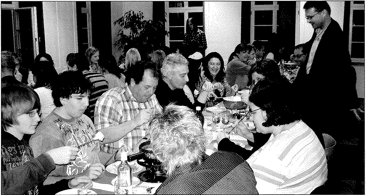
Fondue-Plausch mit Konfirmanden und Eltern.

Ohr für Dich». Das gilt auch für die Lehrlings-Info-Ecke. Die Begleitung führt über Berufsberatung, Hilfe bei der Verfassung des Lebenslaufes, Beratung für das Vorstellungsgespräch, Rechte und Pflichten bis zu Lohnansprüchen. Erste Kontakte mit den Jungen ergeben sich bei Vorträgen in der Primarschule, anschliessende Schulklassenlager vertiefen das Vertrauensverhältnis und öffnen Türen in alle Richtungen.