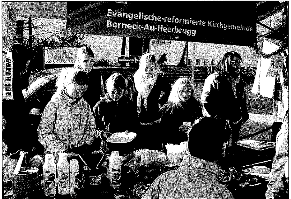
Stand am Adventsmarkt.

und Littering befasste. In einer weiteren Gruppe ging es um die soziale Betreuung von Schülern ab und nach der Oberstufe, unter Beteiligung der betreffenden Gemeinden.